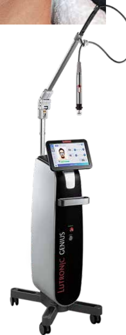
Аппарат Genius Lutronic

Результат терапии оценивался спустя четыре месяца. Отмечено уплотнение кожи, сокращение её площади и снижение растяжимости. Лицо имеет свежий вид, нет тёмных кругов вокруг глаз, складка кожи при пальпации существенно меньше и плотнее. ●